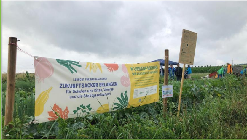
Besuch auf dem Zukunftsacker