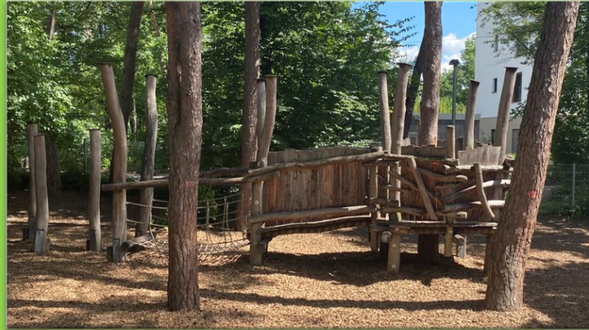
Spielgeräte bei den Schwedenhäusern