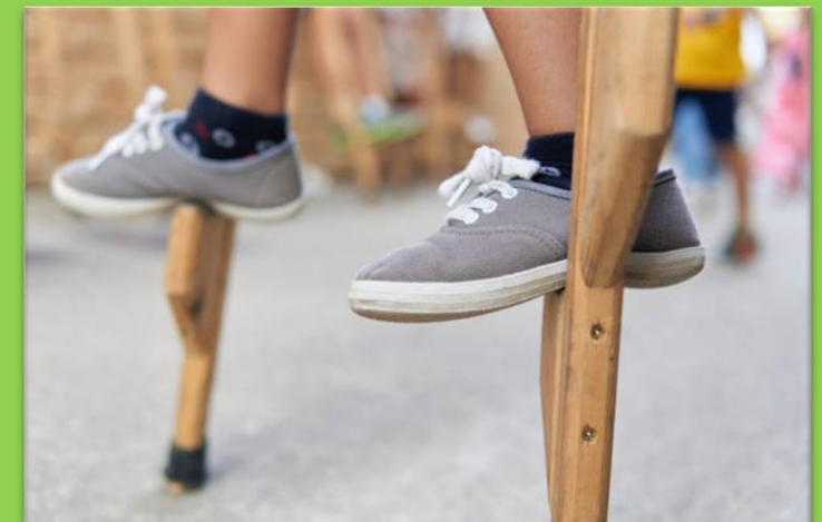
Diverse Spielgeräte für die OGS